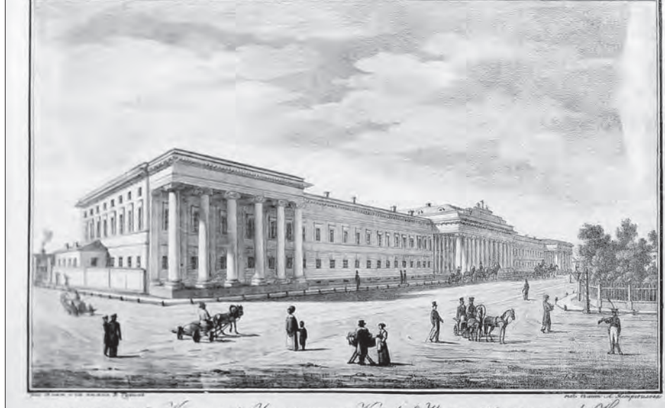
Императорский Казанский университет. Вид с 'L' Universitets' IMPERIAL de Kazan.