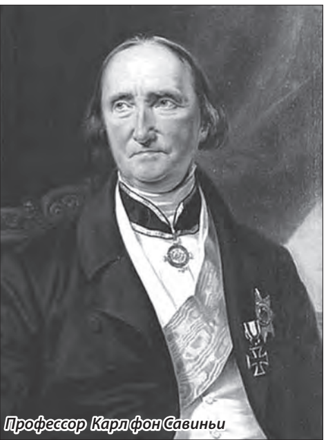
Профессор Карл фон Савиньи