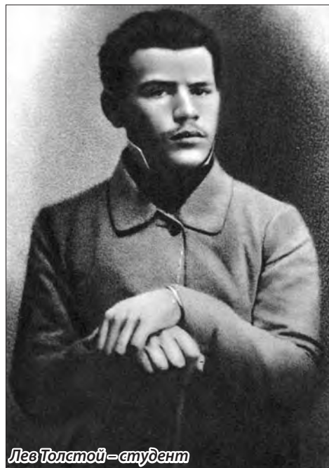
Лев Толстой – студент