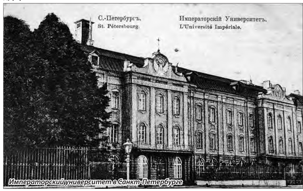
Императорский университет в Санкт-Петербурге